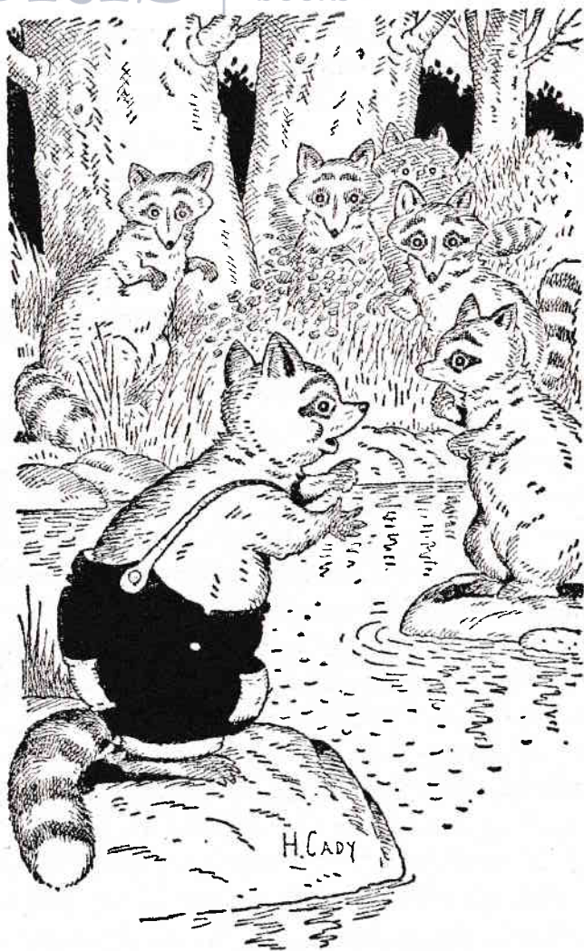
Și Bobi Raton, care adusese cu el toți ratonii care pescuiseră vreodată la Zâmbăltoacă sau în Pârâul Hohot.

începură să vorbească toți deodată, iar dacă Puștiul Bunea ar fi auzit ce se spune despre el la Piatramare, i-ar fi roșit rău de tot obrazul. Cred că-i ieșeau și bășici.